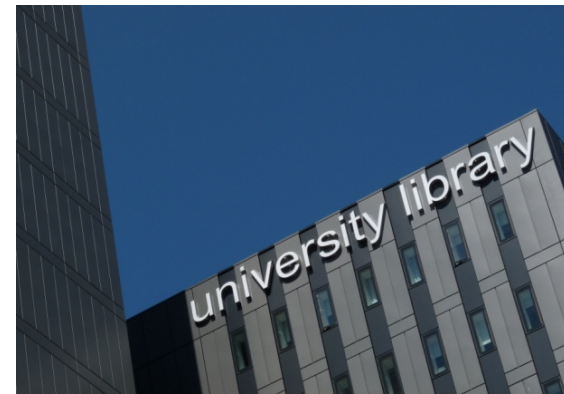
University Library / Rare Books, Glasgow