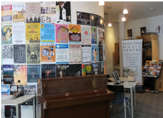
Scottish Music Centre, Glasgow