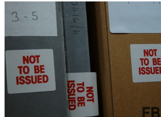
Manu- scripts, NLS