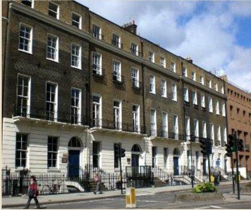
The Wiener Library for the Study of the Holocaust & Genocide