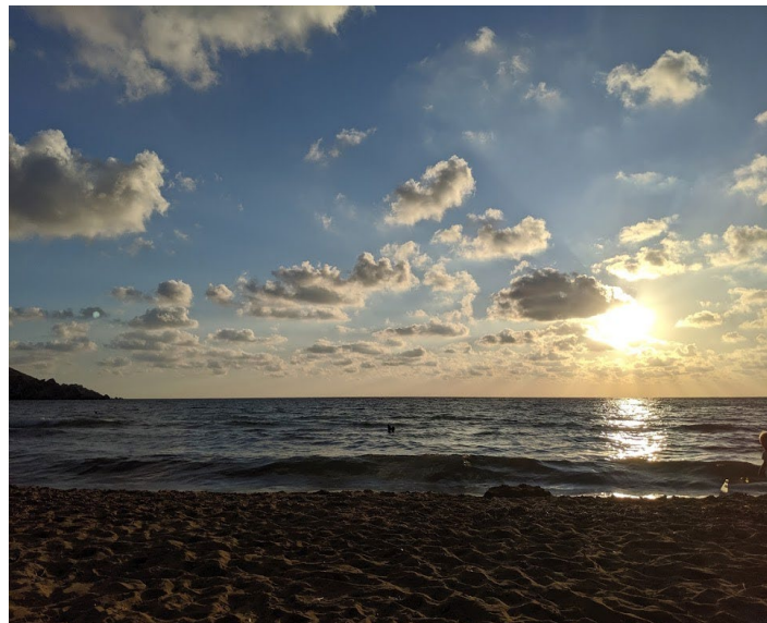
Golden Bay – ein fast tagtäglicher Anblick