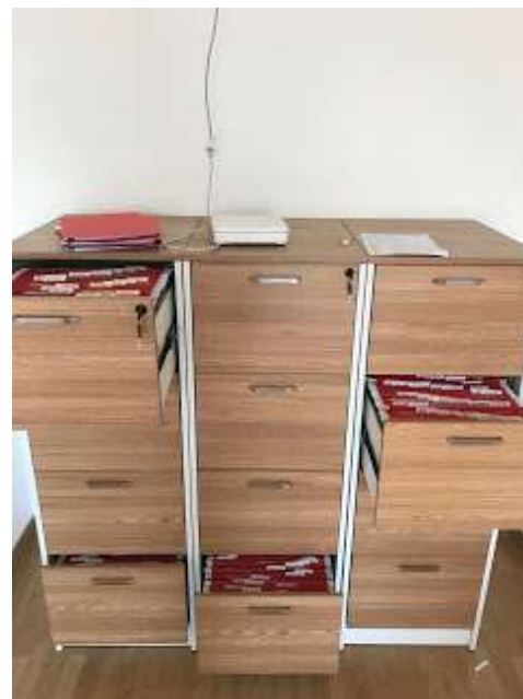
Abbildung 2 Teilnehmerakten