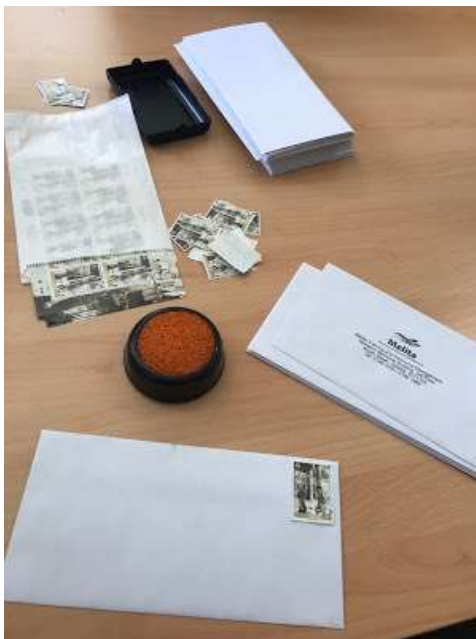
Abbildung 1 Versand von Briefen